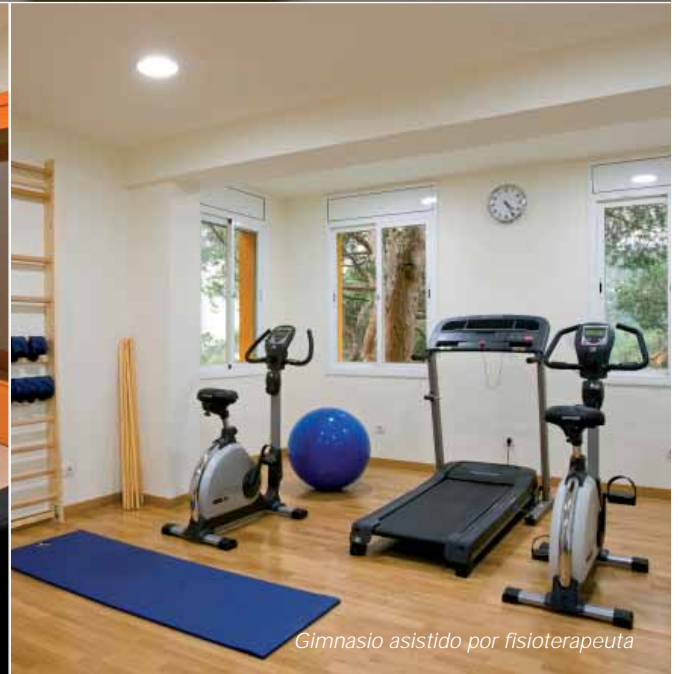
Gimnasio asistido por fisioterapeuta