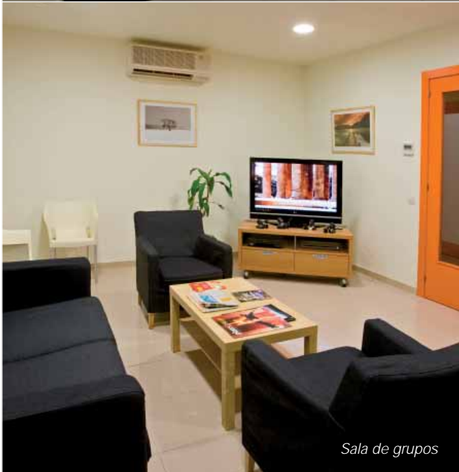
Sala de grupos